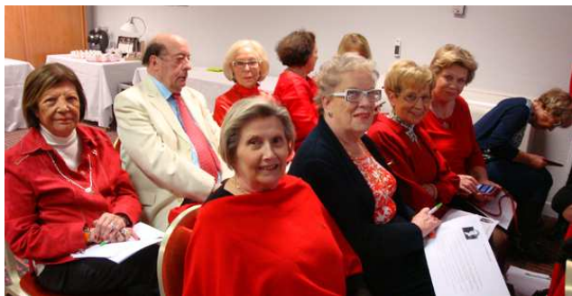
« LA POESIE EN CORPS Un livre à méditer