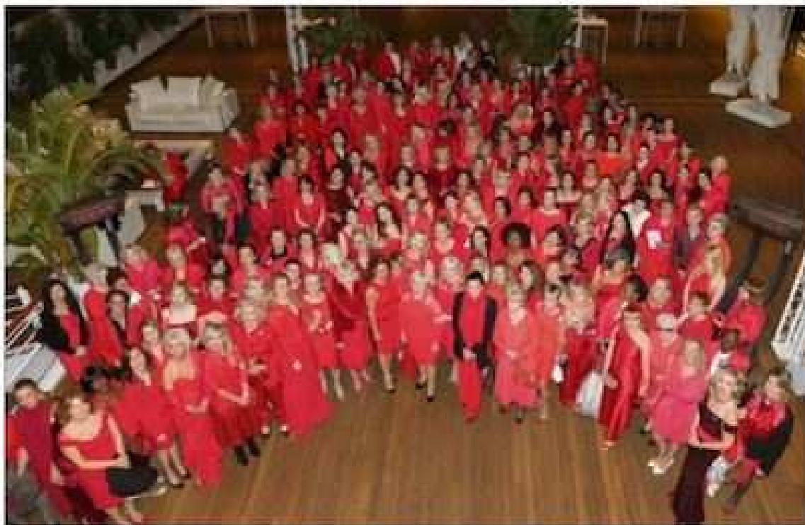
Toutes les femmes se sont rassemblées, autour de la princesse Stéphanie, sur la terrasse du Yacht-club de Monaco pour une grande photo souvenir.

En organisant la troisième soirée de gala « Sauvez le cœur des femmes », l'association monégasque inscrit son action dans la durée. Comme l'année dernière, 40 000 euros ont été récol-