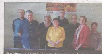
ELECTION. Le nouveau bureau et les vice-présidents.