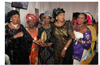
Présidente du Sénégal