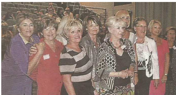
es responsables de comités régionaux, presque au complet.