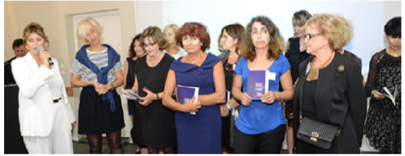
Le Recueil réalisé par le Comité Provence-Méditerranée