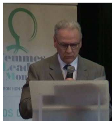
Clôture du Congrès par Monsieur le Préfet du Puy de Dôme Frédéric CHOPIN Qui félicite les Femmes Leaders Mondiales pour leurs actions