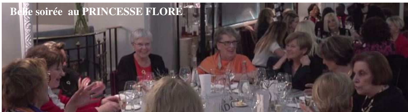
Belle soirée au PRINCESSE FLORE