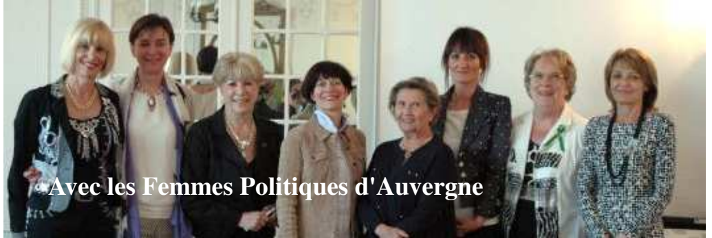
Avec les Femmes Politiques d'Auvergne