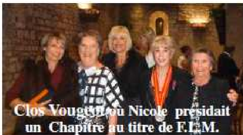
Clos Vougy au Nicole présidait un Chapitre au titre de F.E.M.