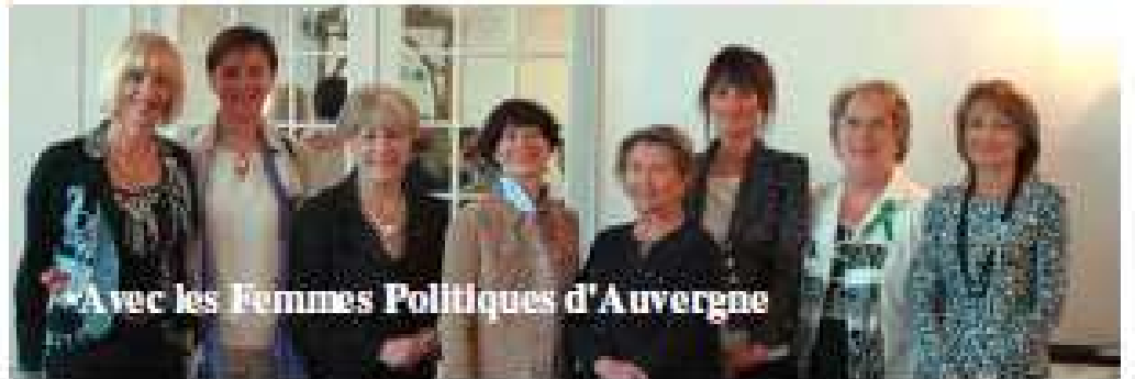
Avec les Femmes Politiques d'Auvergne