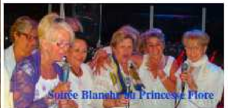
Soirée Blanche au Princess Flore