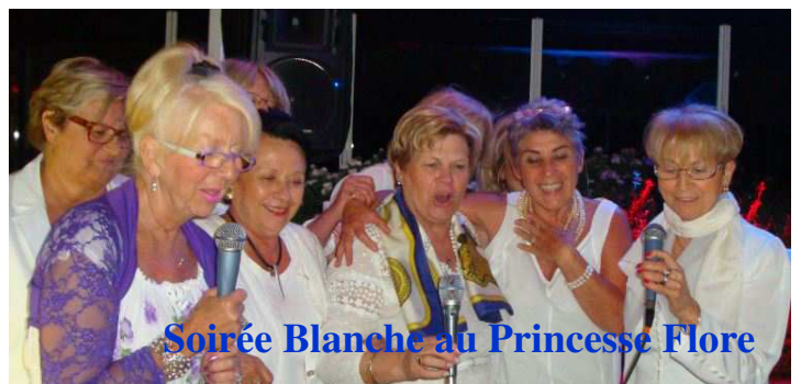
Soirée Blanche au Princesse Flore