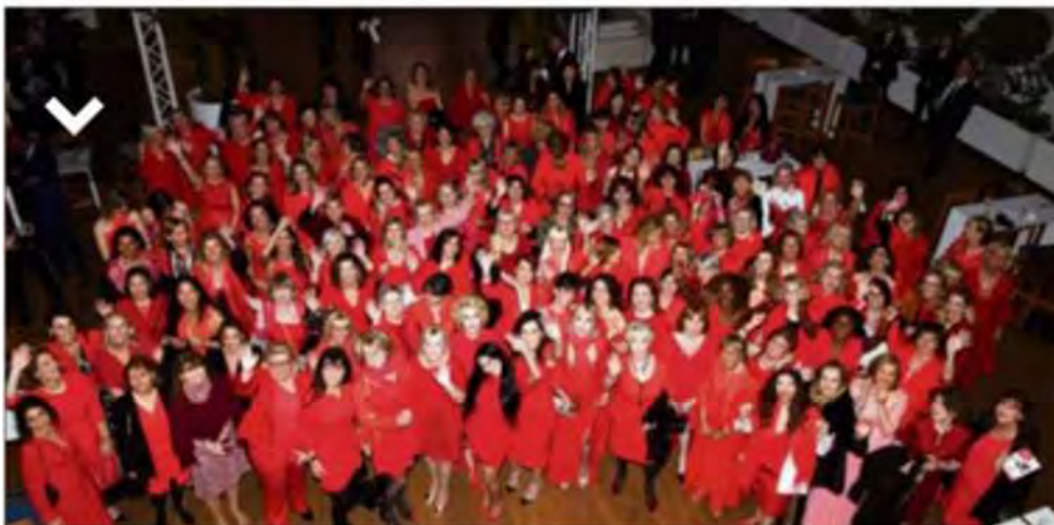
Au Yacht-club, les membres et amis de l'association étaient toutes en rouge pour montrer leur solidarité et leur engagement.