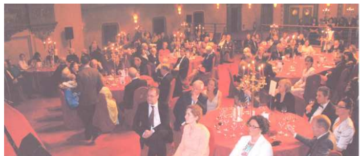
L' Assistance était très nombreuse à cette Soirée