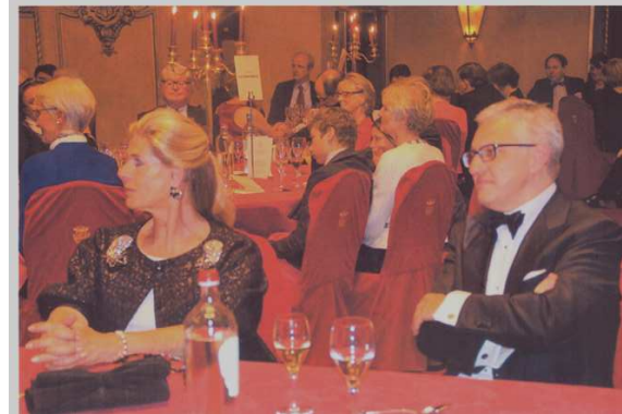
la Princesse Alexandra de Belgique