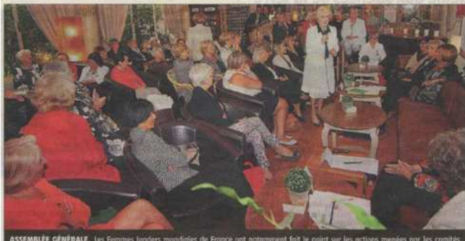
ASSEMBLÉE GÉNÉRALE. Les Femmes leaders mondiales de France ont notamment fait le point sur les actions menées par les comités locaux de douze régions.

RÉSEAU ■ Les Femmes leaders mondiales de France ont débattu à Vichy Une approche féminine pour l'emploi