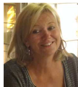
RAPPORT D'ACTIVITE INTERNATIONAL

De plus une demande d'inscription de la Chaîne des Puys au patrimoine mondial de l'UNESCO est en cours