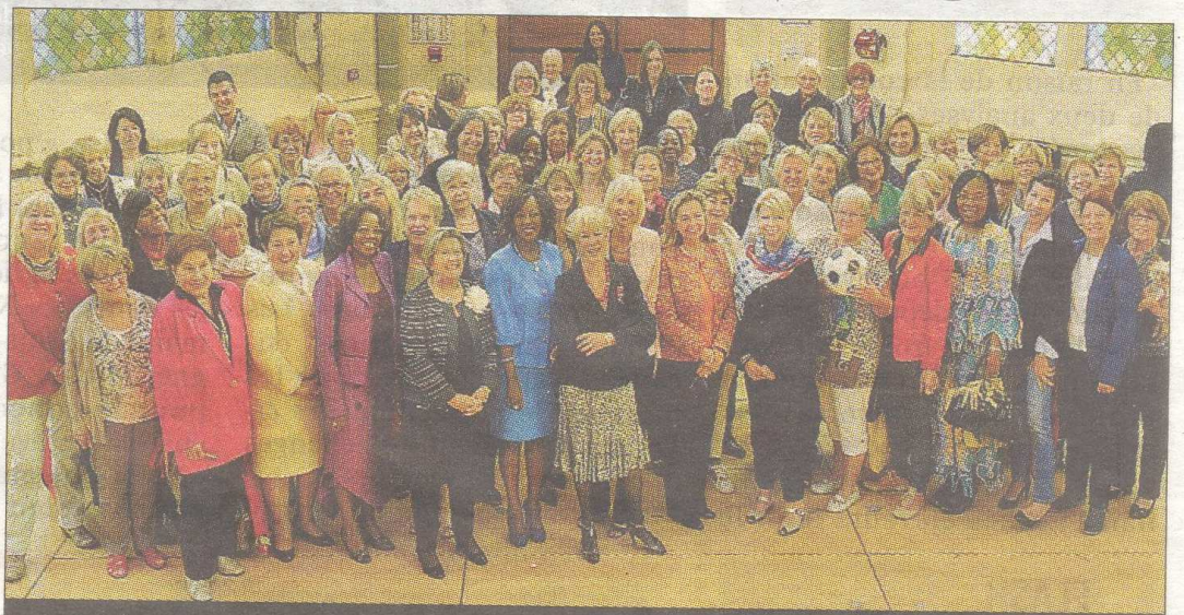
RELAIS. Les Femmes leaders mondiales se sont rassemblées pour mettre en perspective le travail qu'elles effectuent au niveau mondial.

L'occasion pour les femmes leaders de se rencontrer et de découvrir le département. Ainsi, hormis l'assemblée générale et le bilan de l'association, les femmes ont visité Clermont-Ferrand, le puy de Dôme puis se sont rendues à Vichy. Au cours de ce rassemblement, les adhérentes ont également