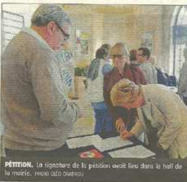
PÉTITION. La signature de la pétition avait lieu dans le hall de la mairie.

Denis Louet Toutes les signatures papiers recueillies, hier, par la municipalité de Vichy, tenaient sur une feuille. Les élus avaient pourtant prévu bien plus de papiers pour la pétition de l'appel du 19 septembre, lancée par l'Association des maires de France.