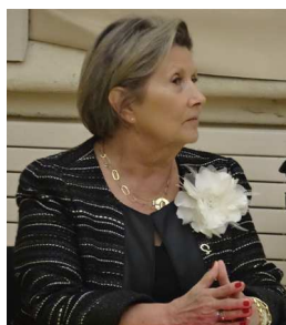
RAPPORT D'ACTIVITE GENERAL