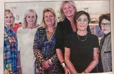
L'association des Femmes Leaders mondiales Monaco s'apprête à monter sur la scène du Théâtre des Variétés.

Lundi 14 décembre, théâtre des Variétés, 1 bd Albert I er à Monaco. Tarifs : 25€. Rés. 06.08.21.98.32 et chantal8@monaco.mc.