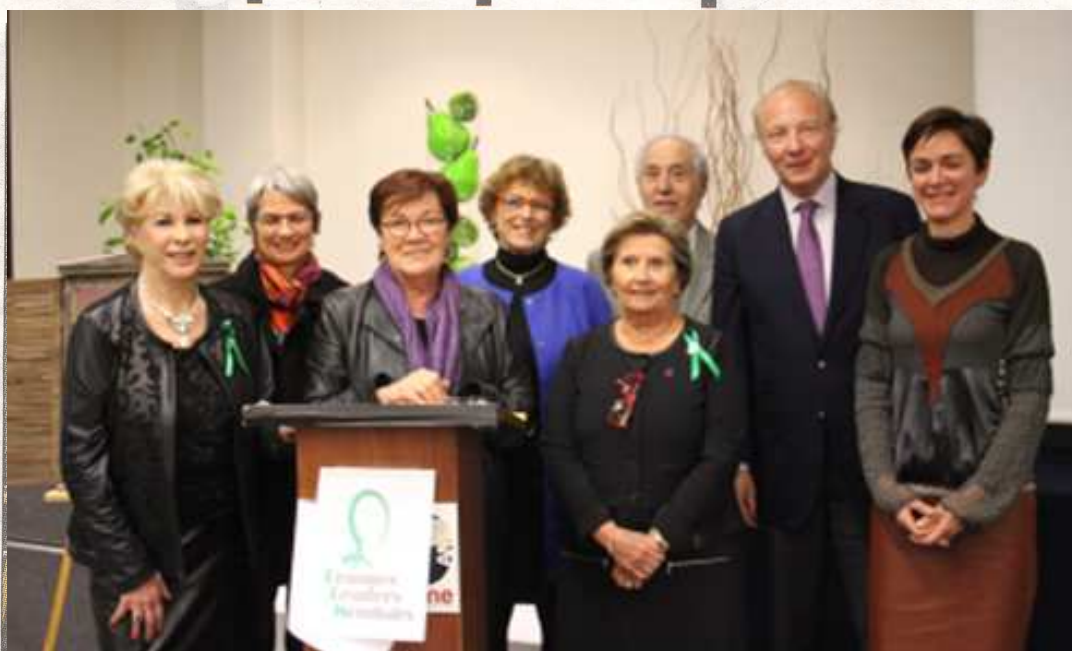
COMBAT. L'association se bat depuis plus de quinze ans se bat pour les droits des femmes.

Cette femme engagée, membre d'honneur de