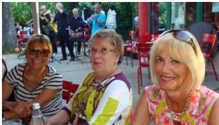
Belle soirée d'été la première ! Le « Gatec Jazz Band » animait