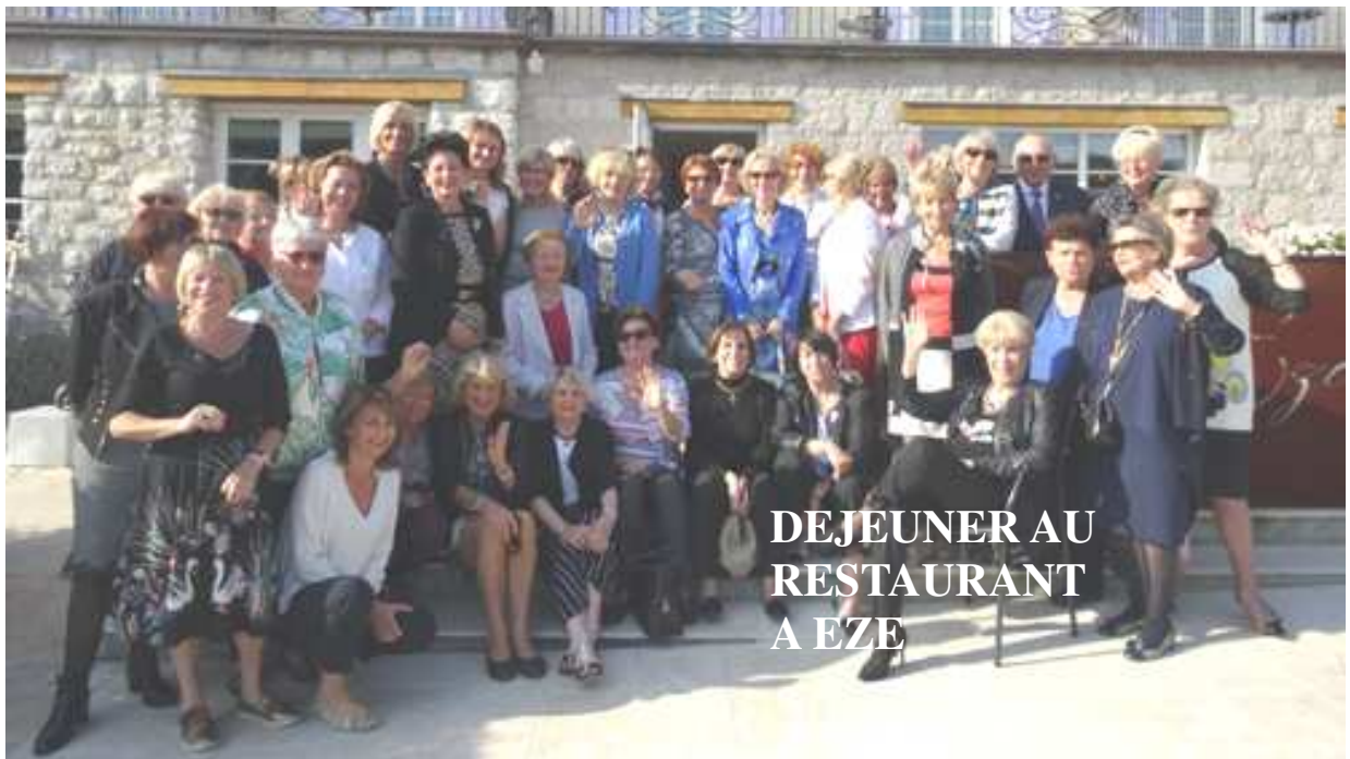
DEJEUNER AU RESTAURANT A EZE