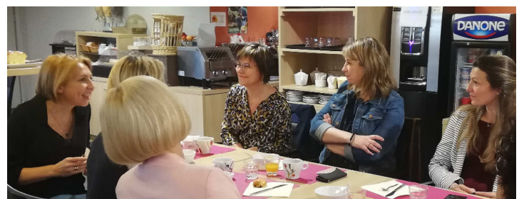
Réunion du Cercle business Femmes Leaders, avec une trentaine d'adhérentes inscrites