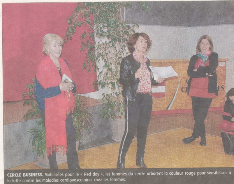
CERCLE BUSINESS. Mobilisées pour le « Red day », les femmes du cercle arborent la couleur rouge pour sensibiliser à la lutte contre les maladies cardiovasculaires chez les femmes.

C'était le cas mardi dernier, avec un temps de présentations