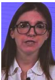
Aurore BERGE Ministre déléguée Chargée de l'égalité

Une des réflexions des universités, pour une égalité véritable fondée sur les conséquences des différences conduisant sur la parité à une réforme constitutionnelle hissant la parité en droit fondamental et en outil de l'égalité